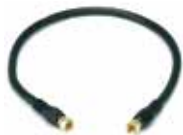
CHICOTE CON CONECTORES (20 cm)