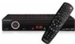
DECODIFICADOR Y CONTROL REMOTO