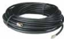
CABLE COAXIAL (10 m.)